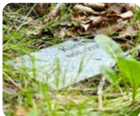
Urnen nedsættes ved foden af det valgte træ, og der kan lægges en mindeplade.

Skovbegravelse er personligt, naturligt og pasningsfrit.