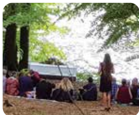
Afhold en smuk og mindeværdig ceremoni i skoven.

Eksempel på et træ med urnegravsteder bestående af enkelt urnepladser.