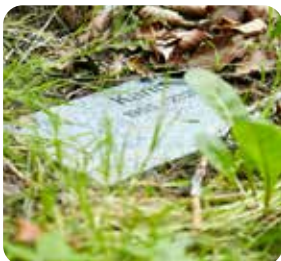
Urnen nedsættes ved foden af det valgte træ, og der kan lægges en mindeplade.

Skovbegravelse er personligt, naturligt og pasningsfrit.