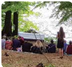
Afhold en smuk og mindeværdig ceremoni i skoven.

Eksempel på et træ med urnegravsteder bestående af enkelt urnepladser.