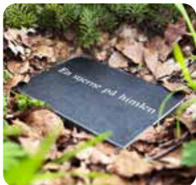
Urnens nedsættes ved foden af det valgte træ, og der kan lægges en mindeplade.

Skovbegravelse er personligt, naturligt og pasningsfrit.