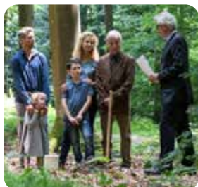
Afhold en smuk og mindeværdig ceremoni i skoven.

Eksempel på et træ med urnegravsteder bestående af enkelt urnepladser.